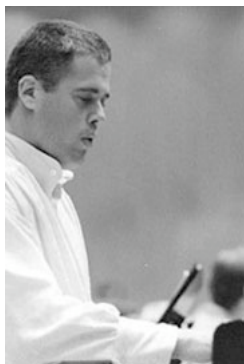
Der Pianist am Flügel