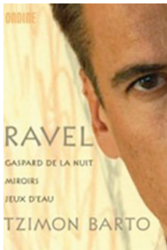
CD mit Werken von Ravel